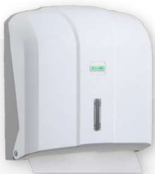
Dispensador ABS largo toalhas papel 300 FL

Referência: DTM300M Cor: Metalizado Unidade por caixa: 10