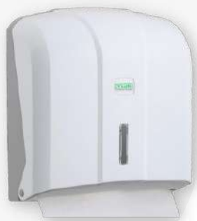
Dispensador ABS toalhas papel 300 FL

Referência: DTM Cor: Branco e cinza Unidade por caixa: 10