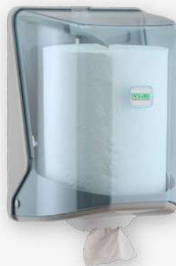
Dispensador transparente rolo mecha / chaminé

Referência: DRMC Cor: Branco e cinza Unidade por caixa: 6