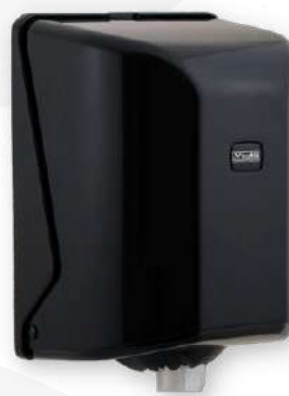
Dispensador ABS black rolo mecha / chaminé / zeta

Referência: DRMCM Cor: Metalizado Unidade por caixa: 6