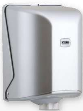
Dispensador ABS rolo mecha / chaminé metalizado

Referência: DRMCA Cor: Cinza e azul transparente Unidade por caixa: 6