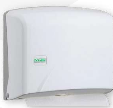
Dispensador ABS toalhas papel 200 FL

Referência: DLTM Cor: Branco e cinza Unidade por caixa: 10