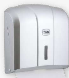
Dispensador ABS toalhas papel 300 FL metalizado

Referência: TA Cor: Cinza e azul transparente Unidade por caixa: 10