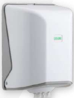
Dispensador ABS rolo mecha / chaminé

Referência: DRMC Cor: Branco e cinza Unidade por caixa: 6