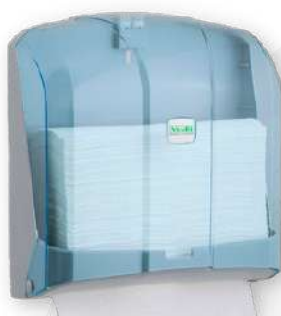
Dispensador ABS toalhas papel 300 FL

Referência: DTM Cor: Branco e cinza Unidade por caixa: 10